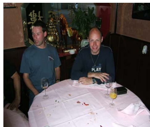
Wat een zootje jongens.