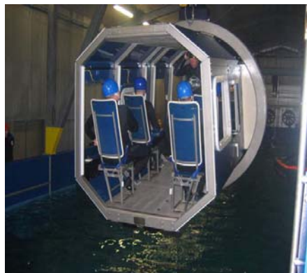
Auto te water